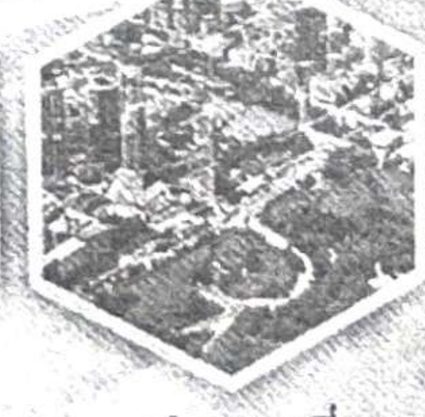
ทำแผนที่