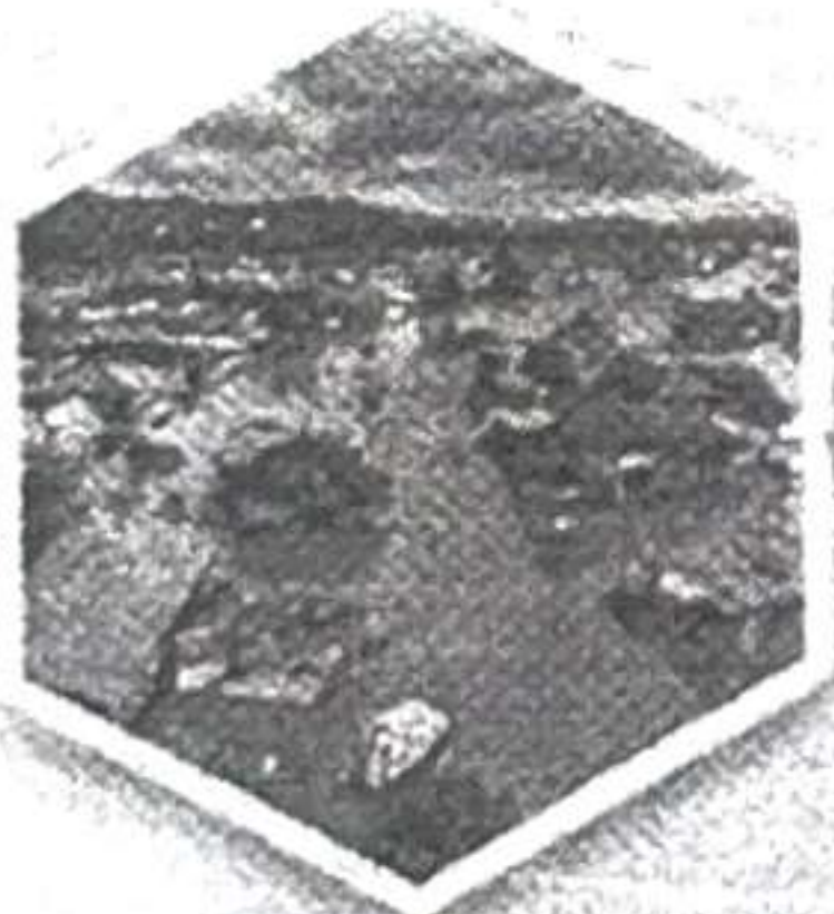
ภัยพิบัติ